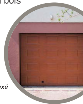
Miami sur mesure en acier plaxé