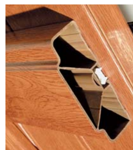
Renforts de barres