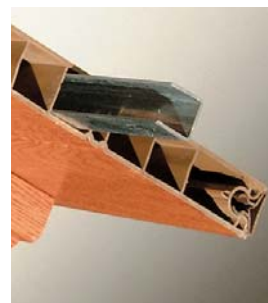
Renforts de lames

Ferrage par pentures et contre-pentures alu festonnées trèfle, fixées par boulons. Gonds à sceller en acier et composite. Condamnation par une espagnolette en tube alu rond. Butées, arrêts à visser et accessoires sont en composite noir.