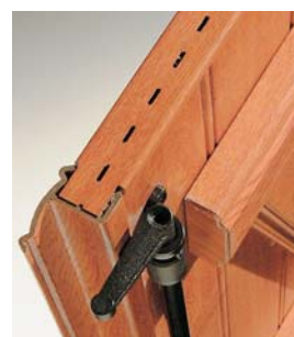
Ventilation du volet